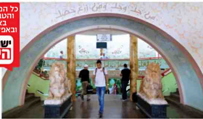
בית הספר התיכון בבית ג'ן. מקום קבוע בצמרת

כל המספרים והטבלאות באתר ובאפליקציה ישראל היום